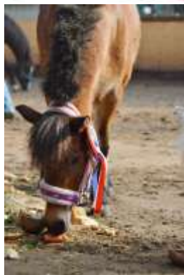
Paard van het jaar 2015